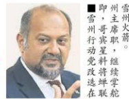
■即雪州主席哥賓星，將為他日後在全国党选出任秘书长一职增添“胜算”。而刘天球方面，他虽然在近期动作频频，并推出新书拉票造势，并发表“草根宣言”，但似乎效果有限。

(八打灵再也12日讯)雪州行动党改选即将于本周日(14日)开打，此次改选有指是史上最多州委候选人的一次，有多达51名候选人将竞争15名州委职位，任何派系人马只要可掌握到至少8人当选的门槛，意味著可掌握雪州行动党的大权，并在复选中十拿九稳的出任州领导职。