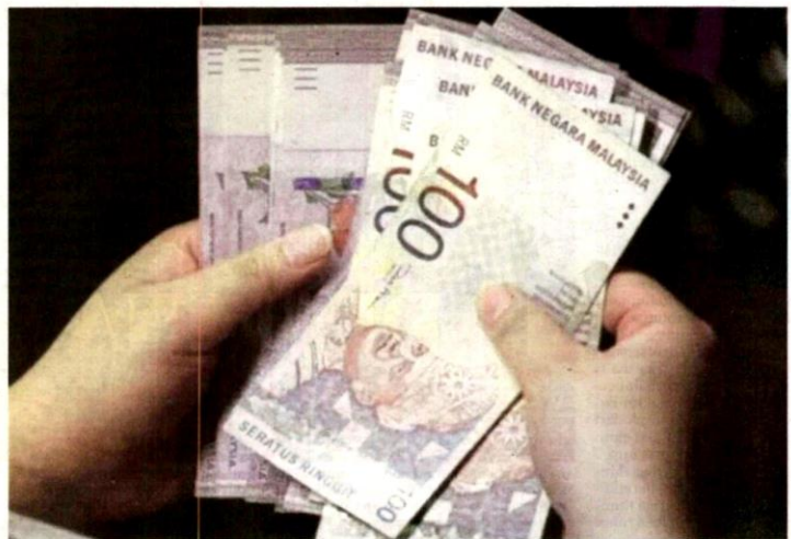
PENIAGA mesti jujur dalam meletak dan menentukan harga barang supaya pembeli dapat membuat keputusan sama ada membeli atau tidak.

Jelasnya, Nabi SAW memerintahkan supaya tidak ada